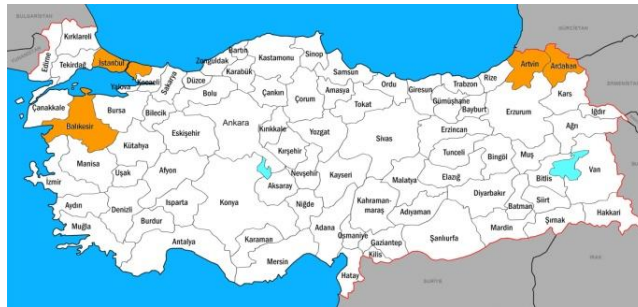
Hanımeli Kelebeği Dağılım Haritası