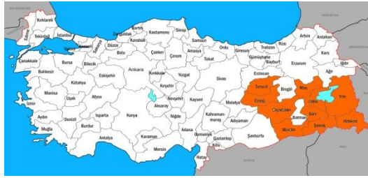
Küçük Yalancı Apollo dağılımı