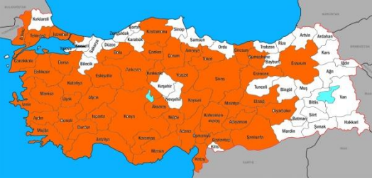
Yalancı Apollo dağılımı

-Ayrımını Küçük Yalancı Apollo ile yapmak gerekir.