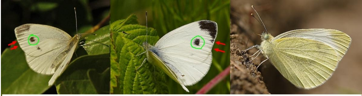
3307 Pieris mannii Mayer, 1851